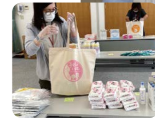
支援物資詰め込み作業の様子